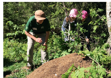
Des élèves découvrent une fourmilière au Marchairuz

Dans cette animation, les élèves approchent la fourmi sous un angle scientifique. Ils découvrent, à travers des activités ludiques, l'anatomie des fourmis, leur habitat et leur organisation sociale au sein d'une fourmilière.